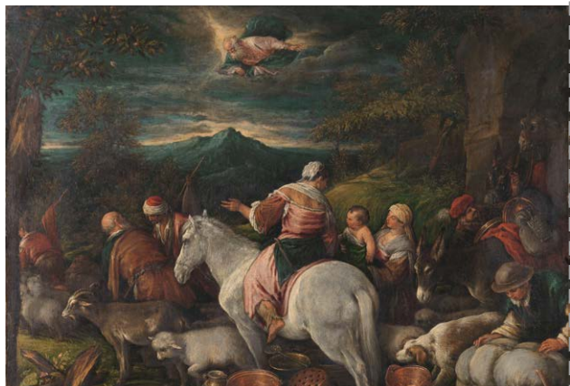
Abraham vertrekt uit Haran Il Bassano, Francesco (toegeschreven aan), 1560–1592.

Pelgrimeren is zoeken naar het betere, waardoor we ons leven een andere betekenis geven.