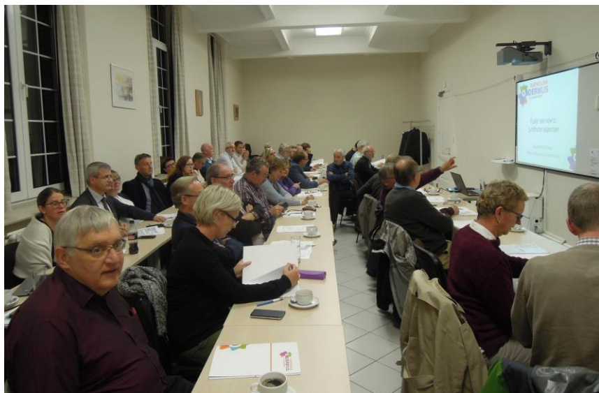
Deelnemers aan de vorming BOS en Juridische aspecten op 23-10-2017 in Mechelen

Alle bestuurders van schoolbesturen van het hele Aartsbisdom krijgen een uitnodiging. Ze kunnen kiezen naar welke locatie ze gaan volgens de datum en de plaats die hen het best schikt.