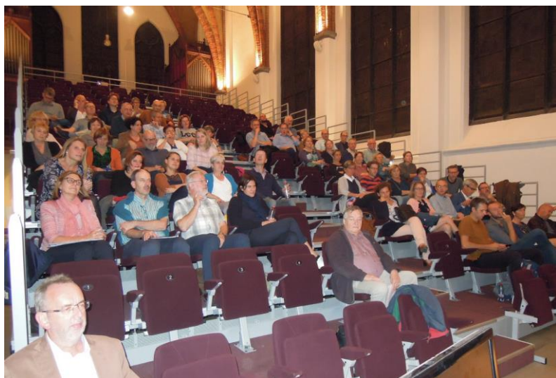
Infovergadering voor directeurs van de regio Leuven in de tot auditorium omgebouwde kerk van Sancta Maria Leuven, op 19-10-2017

In de regio Leuven krijgt het organisatieconcept om zo mogelijk tot één vzw te komen voor de 25 schoolbesturen die met elkaar in gesprek zijn, meer en meer vorm. Steeds meer gemengde werkgroepen (bestuurders en directeurs en/of personeelsleden) verzamelen de nodige gegevens. Een Monitoringcomité met een tiental bestuurders kreeg het mandaat van de Stuurgroep om voorstellen uit te werken en om de werkgroepen te