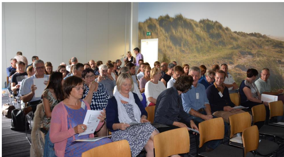
Alle medewerkers van de drie diensten van het Vicariaat onderwijs, samen aan de start van het nieuwe werkjaar.