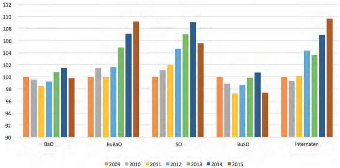
Figuur 1: Werkingsmiddelen per leerling

Uit de figuur blijkt al onmiddellijk een probleem voor het gewoon basisonderwijs en het buitengewoon secundair onderwijs: de werkingsmiddelen per leerling liggen in de meeste jaren van de geanalyseerde periode onder het niveau van het startjaar 2008-2009.