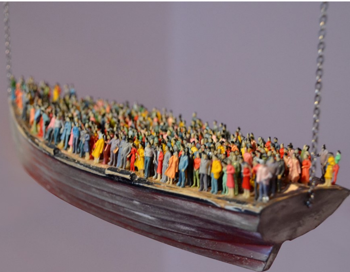
(gemaakt op het kunstenfestival van Watou 2016)

Wanneer we andere mensen, culturen, denkwijzen, religies ontmoeten, stappen we uit onszelf en beginnen we een mooi avontuur dat ‘dialog’ heet.