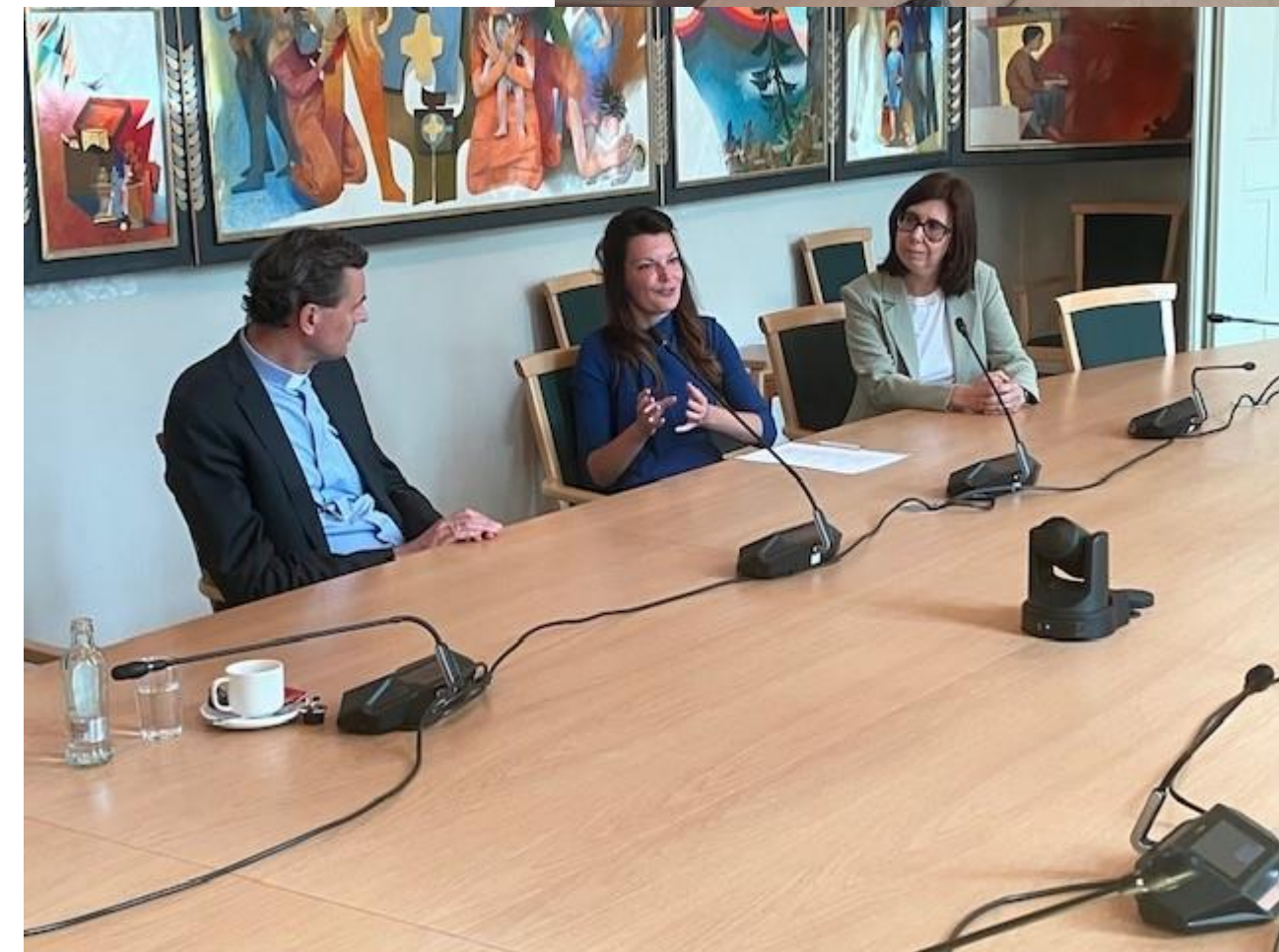
Kennismaking aartsbisschop en team inspectie RKG BaO – 27/5