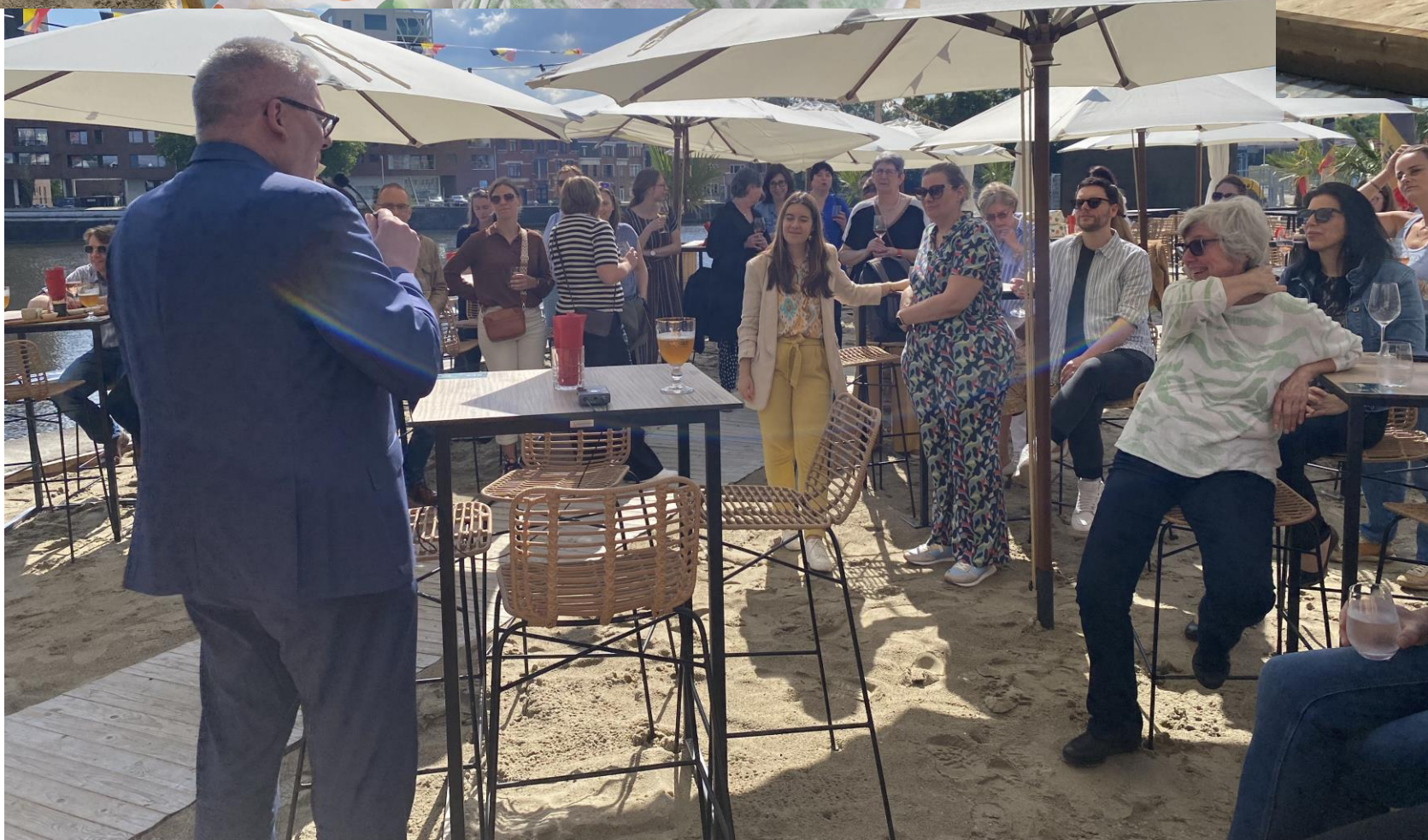
Eindejaarsdrink Vicariaat Onderwijs Mechelen-Brussel en Pedagogische begeleiding Mechelen-Brussel – 19/06