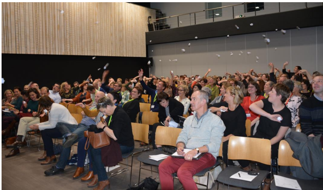
De propjes met vragen om input van collega's vlogen vrolijk de zaal rond.

me?' Luister empathisch en erkennend naar weerstand, zorg voor haalbare uitdagingen, geef feedback die een verbinding maakt. Houd voeling met je eigen behoeftes, je eigen interesses, je eigen motivatie en inspiratie voor jezelf als leidinggevende. Die tips hadden we in de werkwinkel van 's morgens ook al mee gekregen.