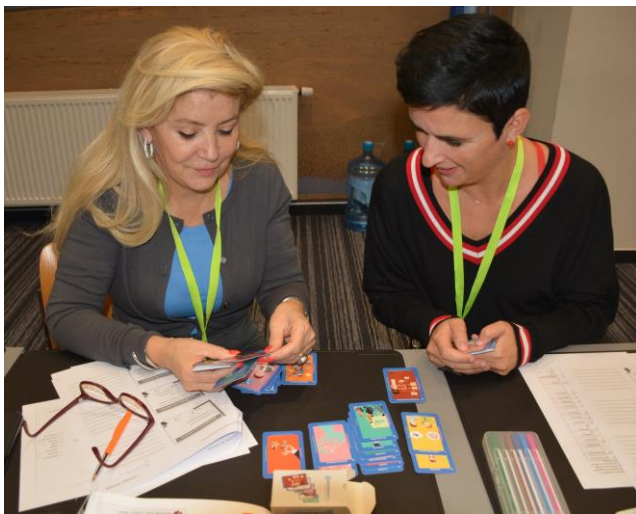
Tijdens de werkwinkel van Karina Verhoeven mochten de deelnemers allerlei opdrachten uitvoeren (© Karina Verhoeven)