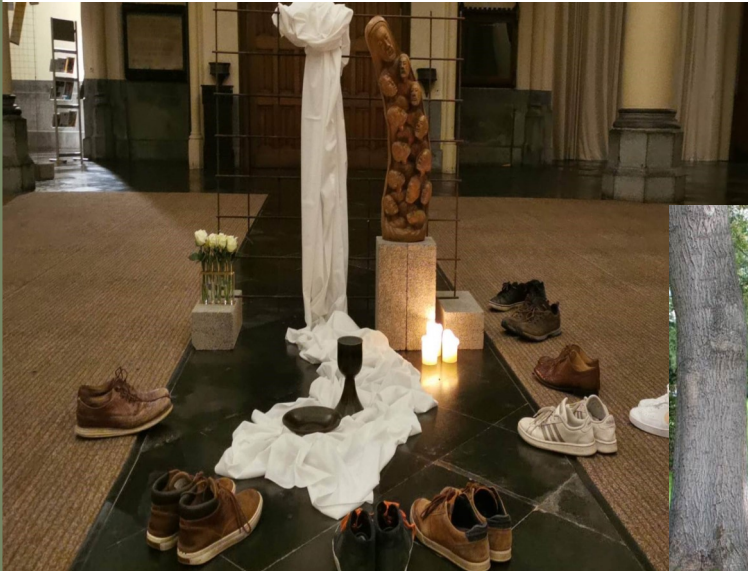
Destination Pasen april 2021, Plussers Roeselare, Onze-Lieve-Vrouwekerk, oktober 2021

Voor oprecht verbinden zijn 7 stappen nodig: luisteren, respecteren, graag zien, aanvoelen, bereid zijn, ontvankelijk zijn en overgaan tot actie. Zoals er in Gods schepping elke dag opnieuw plaats is voor een levende luisterplek, zo zijn wij bereid in te gaan op de oproep die Hij voor ons heeft.