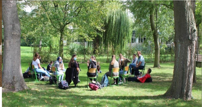
Een lesmoment tussen de bomen in het VABI Roeselare, september 2021