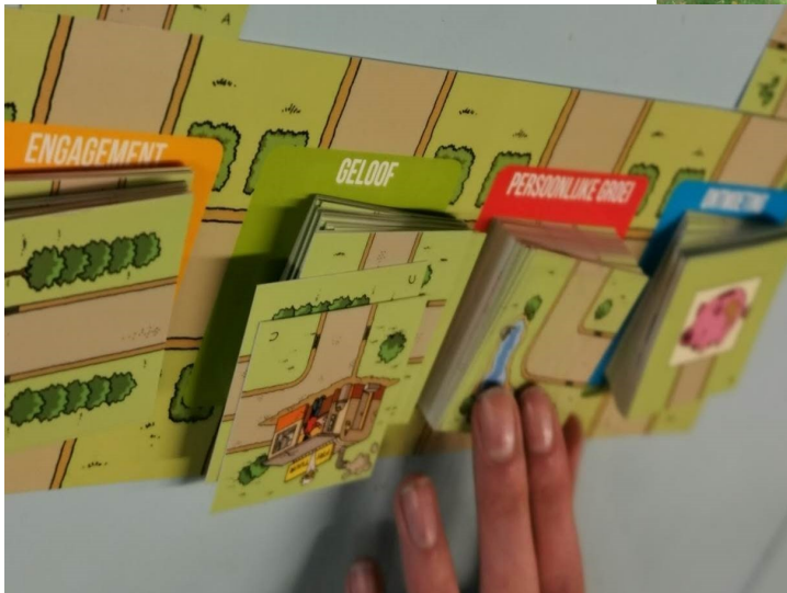
Het ik-Hij-wij-zij spel van IJD, gespeeld met jongeren in het Vrij Agro- en Biotechnisch Instituut (VABI)