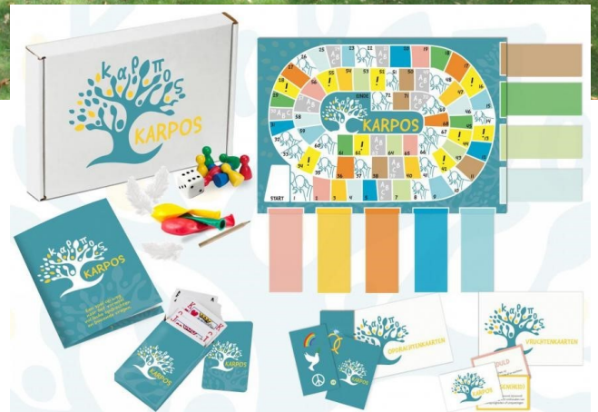
Het Karposspel van IJD Brugge, gespeeld met vormelingen, in gezinnen en op school, mei 2021